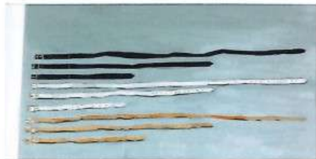
Opgeschorf, Peter Morrens, 2021.

La Louvière Centre Daily-Bul & C° dailybulandco.be