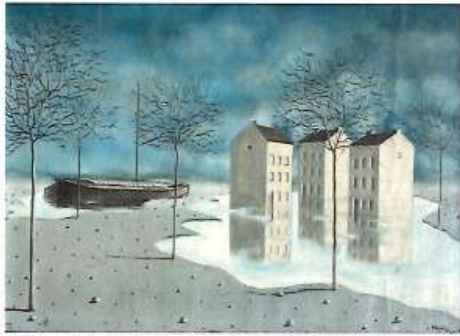
Pol Bury, Untitled, 1945, oil on canvas, Brussels, private collection