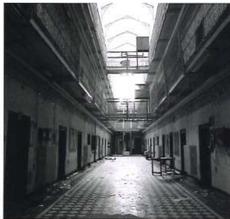
Daniel Turner, Compresseur, extract from the film, 34'08", 2024